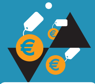
Kosten en meerwaarde