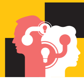
Inspiratie en leren